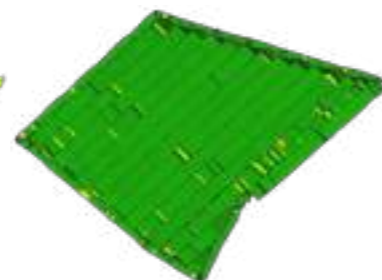
Com Aim Command Flex (L/ha)