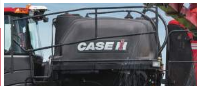
Tanque de produto

Sistema de injeção direta (opcional). Dois tanques, com a capacidade de 100 litros cada, eliminam a necessidade de mistura química no interior do tanque principal. A injeção do produto desses tanques é feita diretamente na linha de barra do pulverizador. Isso proporciona ao agricultor maior facilidade de reabastecimento, economia de insumo e possibilidade de utilizar produtos que são incompatíveis na mistura.