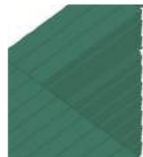
Bico a bico